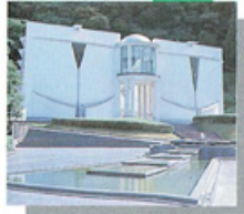
伊豆の長八美術館